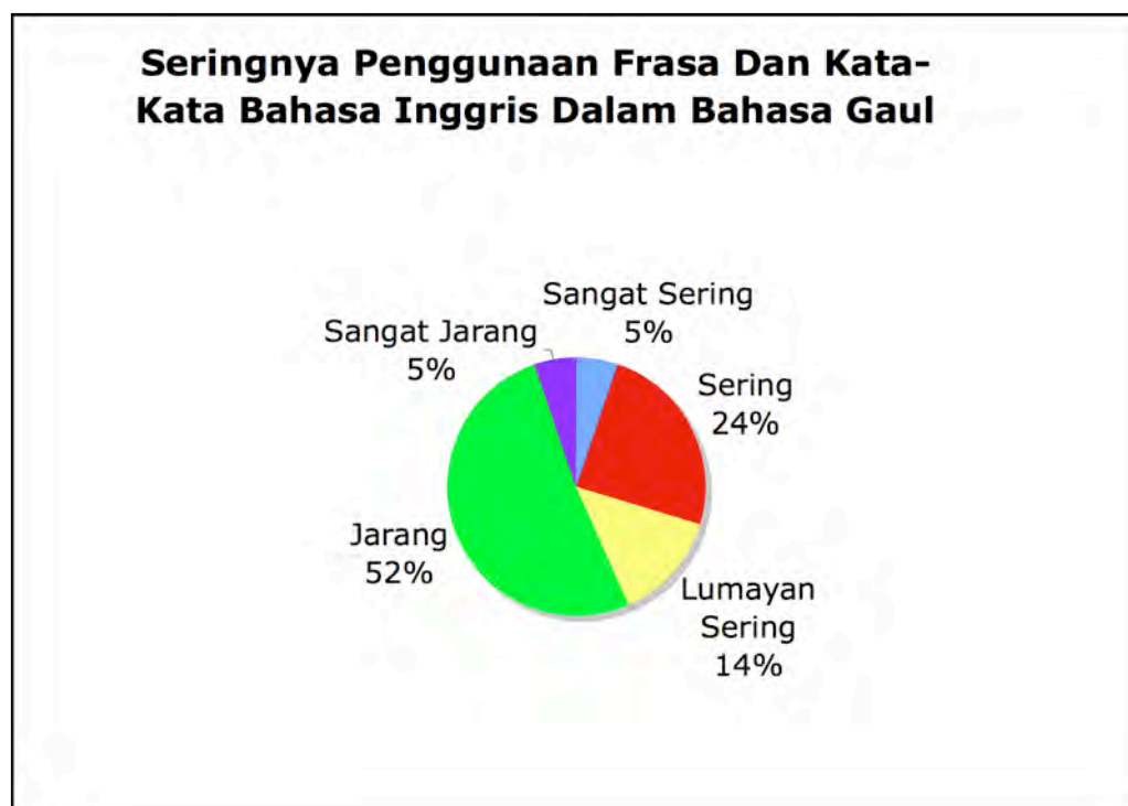
Gambar 6: Seringnya Penggunaan Frasa Dan Kata-Kata Bahasa Inggris Dalam Bahasa Gaul

Bahasa Inggris tidak digunakan dalam Malang dengan sering, selain beberapa kata-kata dan frasa saja. Menurut penelitian saya kebanyakan pemuda berkata mereka jarang menggunakan frasa bahasa Inggris. Lihat Gambar 6 di bawah.