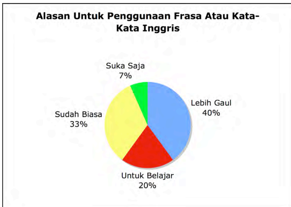
Gambar 5: Alasan Untuk Penggunaan Frasa Atau Kata-Kata Inggris. Disederhanakan dan dikumpulkan dari angket, pertanyaan 4.

Pertanyaan 4 dalam angket mendapat hasil yang lumayan menarik. Menurut hasil pertanyaan itu, 40% menggunakan bahasa Inggris dalam bahasa gaulnya karena penggunaan itu lebih ‘gaul’ atau lebih ‘hebat’. 33% menganggap penggunaan bahasa Inggris sebagai ‘sudah biasa’, 20% menggunakan frasa bahasa Inggris untuk menaikkan keahlian bahasa Inggrisnya, dan 7% ‘suka saja’.