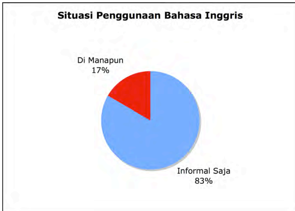
Gambar 2: Situasi Penggunaan Bahasa Inggris. Dikumpulkan dari angket, pertanyaan 5.

Menurut hasil penelitian saya bahasa Inggris tidak diterima di kebanyakan situasi: 17% orang menggunakan bahasa Inggris dalam situasi apapun tetapi 83% dalam situasi informal saja.