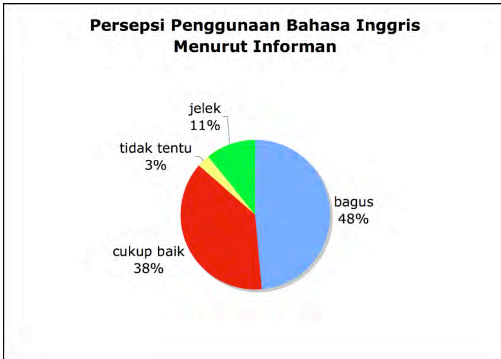
Gambar 4: Persepsi Penggunaan Bahasa Inggris Menurut Informan. Dikumpulkan dari angket, pertanyaan 8.

Kita dapat melihat di gambar 3 dan gambar 4 bahwa penggunaan bahasa Inggris dianggap sebagai fenomena baik (atau fenomena yang tidak dapat dihentikan) oleh kebanyakan informan. Gambar 3 mempertunjuk hasil cobaan saya untuk membandingkan persepsi informan terhadap penggunaan sendiri dengan persepsinya tentang pikiran yang lain terhadap penggunaan itu. Jadi perbedaan di antara keduanya merefleksikan perbedaan di antara kelompok yang menggunakan bahasa Inggris dan masyarakat biasa.