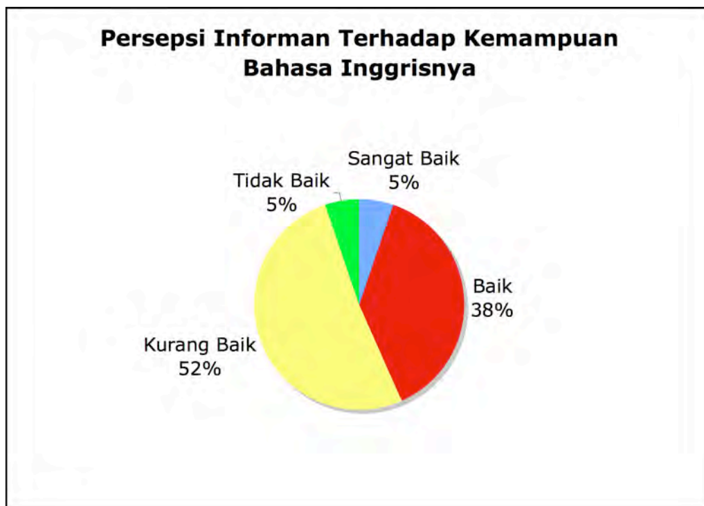
Gambar 8: Persepsi Informan Terhadap Kemampuan Bahasa Inggrisnya.

Menurut pendapat informan, kebanyakannya (57%) menganggap kemampuannya dalam bahasa Inggris sebagai 'kurang baik' (52%) atau 'tidak baik' (5%) dan yang lain (43%) menganggap kemampuannya sebagai 'baik' (38%) atau 'sangat baik' (5%). Menurut pendapat saya hasil ini lumayan menarik. Selama penelitian saya sangat jarang bertemu dengan mahasiswa yang dapat berbahasa Inggris dengan lancar, jadi saya percaya ada kebenaran dalam hasil tersebut.