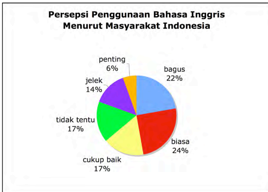
Gambar 3: Persepsi Penggunaan Bahasa Inggris Menurut Masyarakat Indonesia. Dikumpulkan dari angket, pertanyaan 7.

Kebanyakan informan percaya bahwa penggunaan bahasa Inggris dianggap oleh masyarakat sebagai bagus atau sudah biasa di Indonesia. Lebih banyak sumber informan menjawab bahwa menurut pendapat mereka penggunaan bahasa Inggris adalah fenomena yang cukup baik atau bagus.